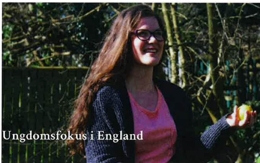
Ungdomsfokus i England

Avkoloniseringen etter 2. verdenskrig har gjort det til et mer vanlig land, men innflytelsen i internasjonal sammenheng er fortsatt stor. Storbritannia har sterke bånd til sine tidligere kolonier, og mange innflyttere fra disse landene har bidratt til å gjøre landet multikulturelt. En sterk velferdsstat gjør sitt til at landet har en av verdens høyeste levestandarder, selv om det engelske samfunn er uvanlig skarpt klassesdelt. Vårt arbeid er fokusert i Cumbria fylke, helt på grensen til Skottland. Cumbria er det tynnest befolkede fylket i England. Bortsett fra Carlise by og noen få tettsteder, er det veldig landlig med seks ganger så mange sauer som mennesker. Postman Pats hjembygd er inspirert av Longsleddale Village midt i fylket og gir faktisk et veldig godt bilde av hvordan store deler av fylket ser ut.